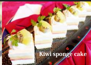
Kiwi sponge cake