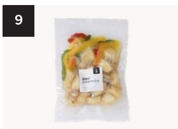
9 真鯛のエスカベッシュ

250g・湯せん 10 分 【小麦 / 乳成分 / 牛肉 / 大豆 / 鶏肉 / 豚肉 / りんご / ゼラチン】