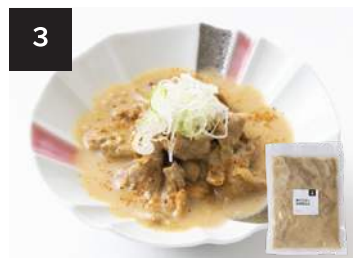
3 豚ホルモン味噌煮込み

160g・湯せん 10 分 【小麦 / 卵 / 乳成分 / 牛肉 / 大豆 / 豚肉 / ゼラチン】