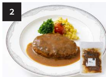
2 煮込みハンバーグ