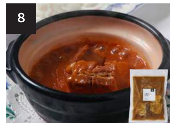
8 土鍋カレーソース

海老 8 尾 170g・湯せん 3 分 【小麦 / 大豆 / 海老 / 卵 / 乳製分 / ごま / りんご】