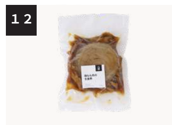
12 鶏もも肉の生姜煮