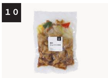
10 鶏のカシューナッツ炒め