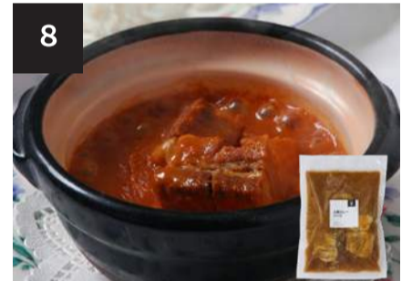
8 土鍋カレーソース 600円

海老 8尾 170g・湯せん 3分 【小麦 / 大豆 / 海老 / 卵 / 乳製分 / ごま / りんご】