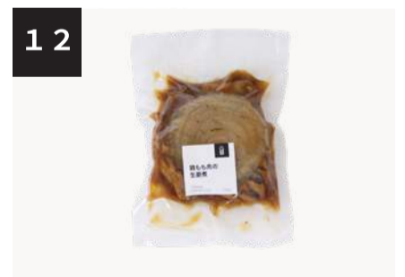
12 鶏もも肉の生姜煮 500円