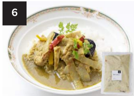
6 グリーンカレー 500円

300g・湯せん 12分 【小麦 / 乳製分 / ごま / 鶏肉 / 豚肉 / りんご】