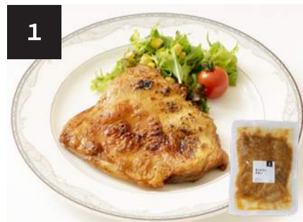
1 タンドリーチキン 500円

[60 サイズ] 260×180×90 mm [80 サイズ] 360×250×90 mm / 400×280×90 mm