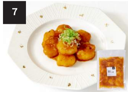
7 海老のチリソース煮 600円

海老 8尾 170g・湯せん 3分 【小麦 / 大豆 / 海老 / 卵 / 乳製分 / ごま / りんご】