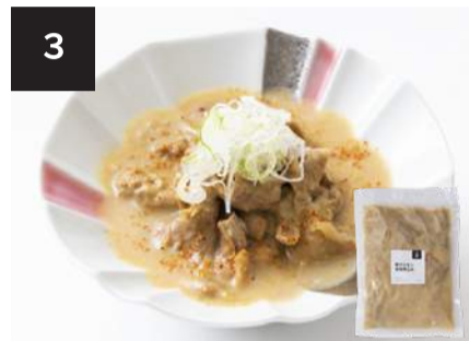
3 豚ホルモン味噌煮込み 500円

160g・湯せん 10分 【小麦 / 卵 / 乳成分 / 牛肉 / 大豆 / 豚肉 / ゼラチン】