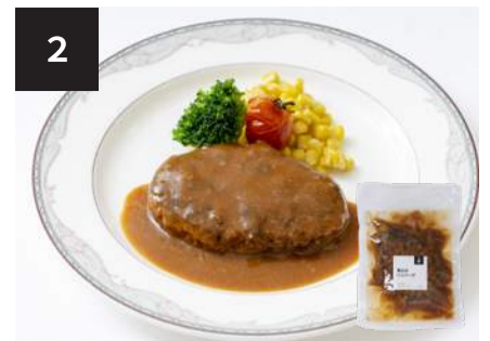
2 煮込みハンバーグ 500円

160g・湯せん 10分 【小麦 / 卵 / 乳成分 / 牛肉 / 大豆 / 豚肉 / ゼラチン】