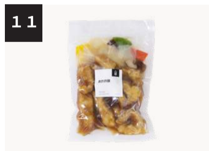
11 黒酢酢豚 500円