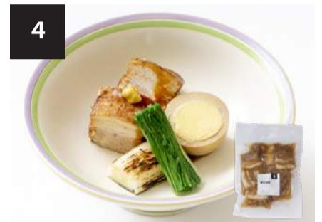
4 豚の角煮 500円