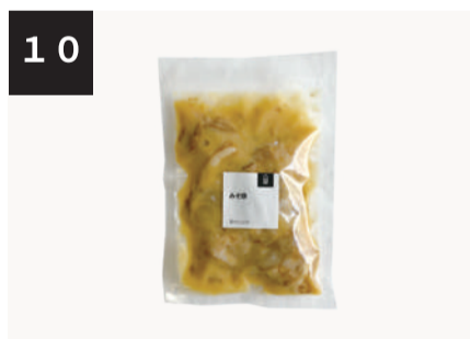
10 みそ豚 500円

電子レンジ 600w 7分 【小麦 / 大豆 / 海老 / いか / 乳製分 / ゼラチン】