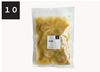
10 みそ豚 550 円

電子レンジ 600w 7 分 【小麦 / 大豆 / 海老 / いか / 乳製分 / 牛肉 / 鶏肉】