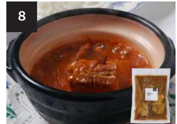
8 土鍋カレーソース 650 円

海老 8 尾 170g・湯せん 3 分 【小麦 / 大豆 / 海老 / 卵 / 乳製分 / ごま / りんご】