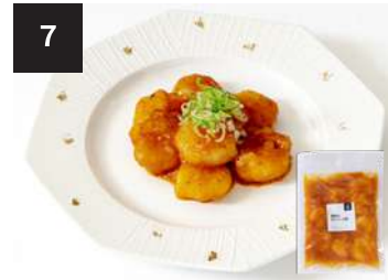
7 海老のチリソース煮 650 円

海老 8 尾 170g・湯せん 3 分 【小麦 / 大豆 / 海老 / 卵 / 乳製分 / ごま / りんご】