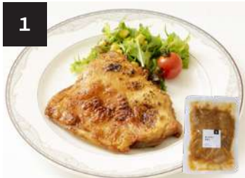
1 タンドリーチキン 550 円

ヤマトクール宅急便で、全国配 送承ります。配送料等詳しくは お問い合わせください。