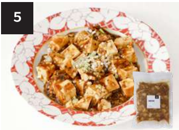
5 麻婆豆腐 550 円

300g・湯せん 12 分 【小麦 / 乳製分 / ごま / 鶏肉 / 豚肉 / りんご】