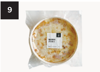
9 海の幸のグラタン 550 円

250g・湯せん 10 分 【小麦 / 乳成分 / 牛肉 / 大豆 / 鶏肉 / 豚肉 / りんご / ゼラチン】