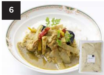
6 グリーンカレー 550 円

300g・湯せん 12 分 【小麦 / 乳製分 / ごま / 鶏肉 / 豚肉 / りんご】