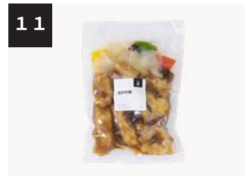
11 黒酢酢豚 550 円