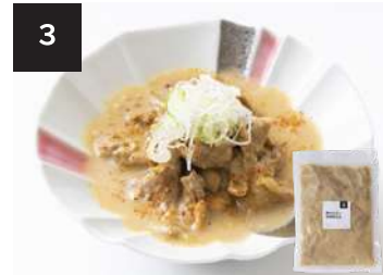
3 豚ホルモン味噌煮込み 550 円

160g・湯せん 10 分 【小麦 / 卵 / 乳成分 / 牛肉 / 大豆 / 豚肉 / ゼラチン】