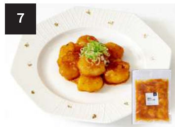
7 海老のチリソース煮 650円

海老 8尾 170g・湯せん 3分 【小麦 / 大豆 / 海老 / 卵 / 乳製分 / ごま / りんご】