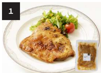
1 タンドリーチキン 550円

ヤマトクール宅急便で、全国配 送承ります。配送料等詳しくは お問い合わせください。