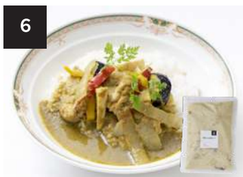
6 グリーンカレー 550円

300g・湯せん 12分 【小麦 / 乳製分 / ごま / 鶏肉 / 豚肉 / りんご】