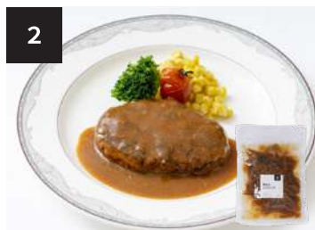
2 煮込みハンバーグ 550円

160g・湯せん 10分 【小麦 / 卵 / 乳成分 / 牛肉 / 大豆 / 豚肉 / ゼラチン】