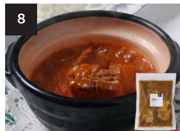
8 土鍋カレーソース 650円

海老 8尾 170g・湯せん 3分 【小麦 / 大豆 / 海老 / 卵 / 乳製分 / ごま / りんご】