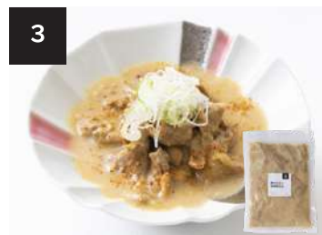
3 豚ホルモン味噌煮込み 550円

160g・湯せん 10分 【小麦 / 卵 / 乳成分 / 牛肉 / 大豆 / 豚肉 / ゼラチン】