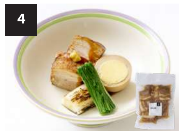
4 豚の角煮 550円