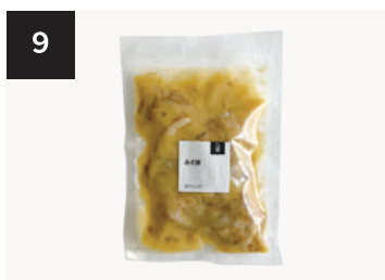
9 みそ豚 550円

250g・湯せん 10分 【小麦 / 乳成分 / 牛肉 / 大豆 / 鶏肉 / 豚肉 / りんご / ゼラチン】