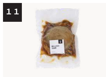
11 鶏もも肉の生姜煮 550円