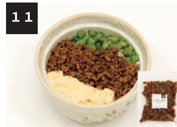
11 しれっと♪そぼろ (大豆ミート) 300円