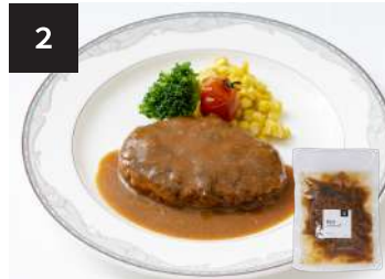
2 煮込みハンバーグ 550円

160g・湯せん 10分 【小麦 / 卵 / 乳成分 / 牛肉 / 大豆 / 豚肉 / ゼラチン】