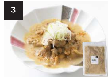
3 豚ホルモン味噌煮込み 550円

160g・湯せん 10分 【小麦 / 卵 / 乳成分 / 牛肉 / 大豆 / 豚肉 / ゼラチン】