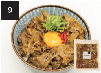
9 牛ごぼう丼の具 500円

250g・湯せん 10分 【小麦 / 乳成分 / 牛肉 / 大豆 / 鶏肉 / 豚肉 / りんご / ゼラチン】