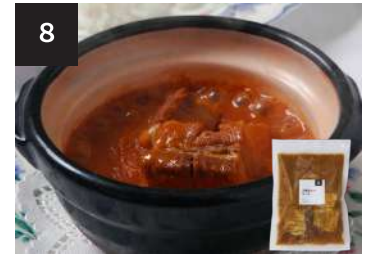
8 土鍋カレーソース 650円

海老 8尾 170g・湯せん 3分 【小麦 / 大豆 / 海老 / 卵 / 乳成分 / ごま / りんご】