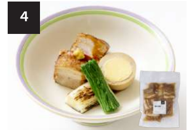
4 豚の角煮 550円