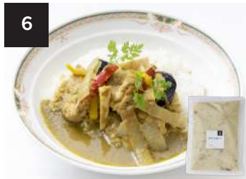
6 グリーンカレー 550円

300g・湯せん 12分 【小麦 / 乳成分 / ごま / 鶏肉 / 豚肉 / りんご】