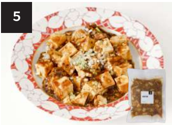
5 麻婆豆腐 550円

300g・湯せん 12分 【小麦 / 乳成分 / ごま / 鶏肉 / 豚肉 / りんご】