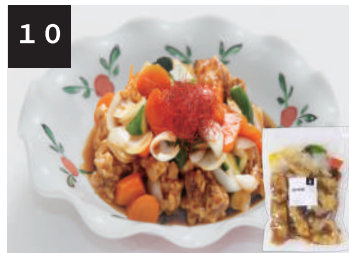
10 黒酢酢豚 550円