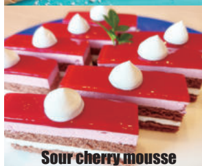
Sour cherry mousse