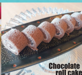
Chocolate roll cake