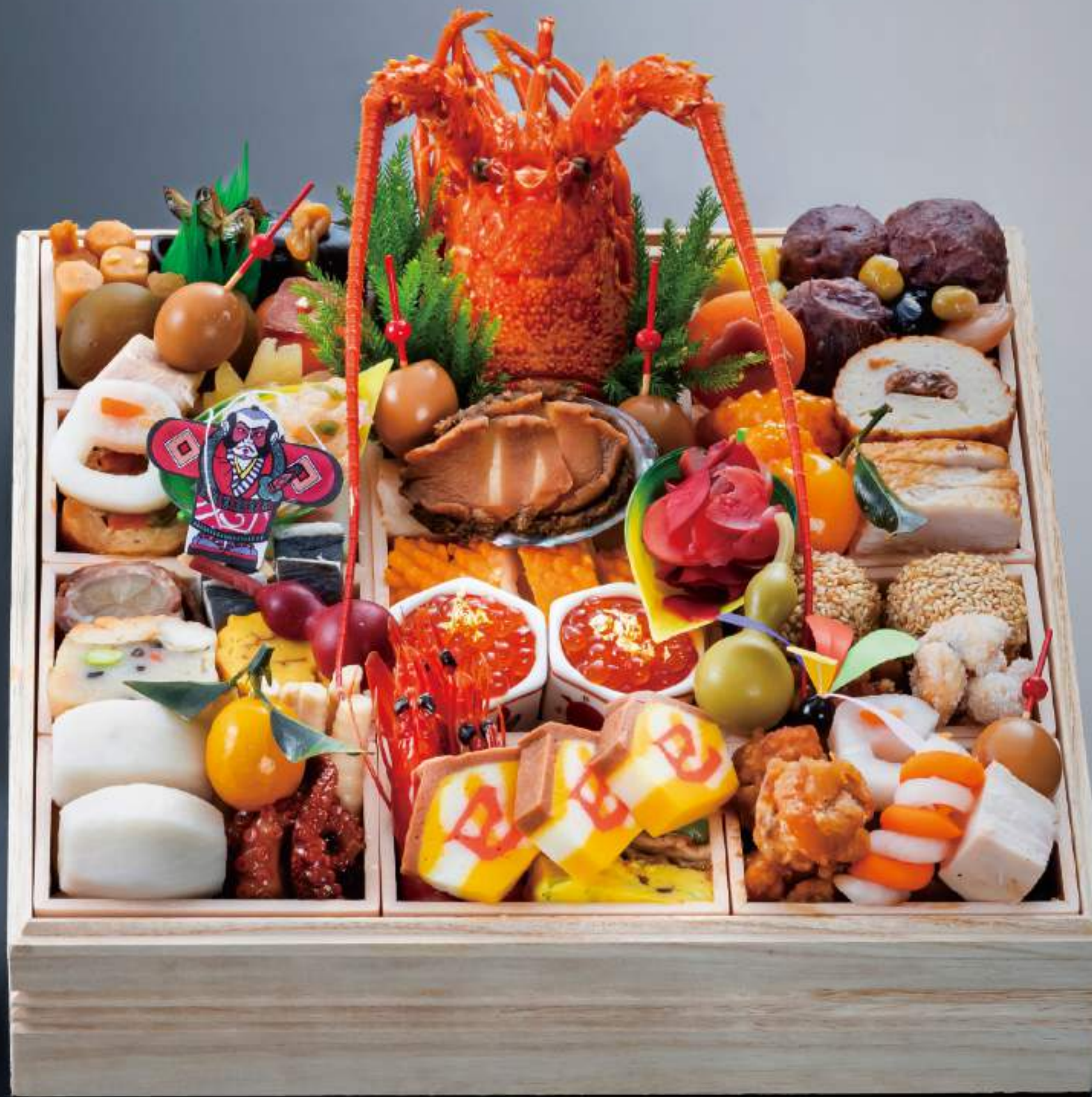
重箱 27cm × 27cm (4~5人前)